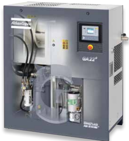
GA 22 + FF mit integriertem OSD-System

Überwachung und Wartung sind ein Kinderspiel. Steigt der über ein Display eindeutig ablesbare Einlassdruck auf 2 bar, muss die leicht zugängliche und aufschraubbare Filterpatrone ausgetauscht werden. Dies geschieht in der Regel im Jahresrhythmus.